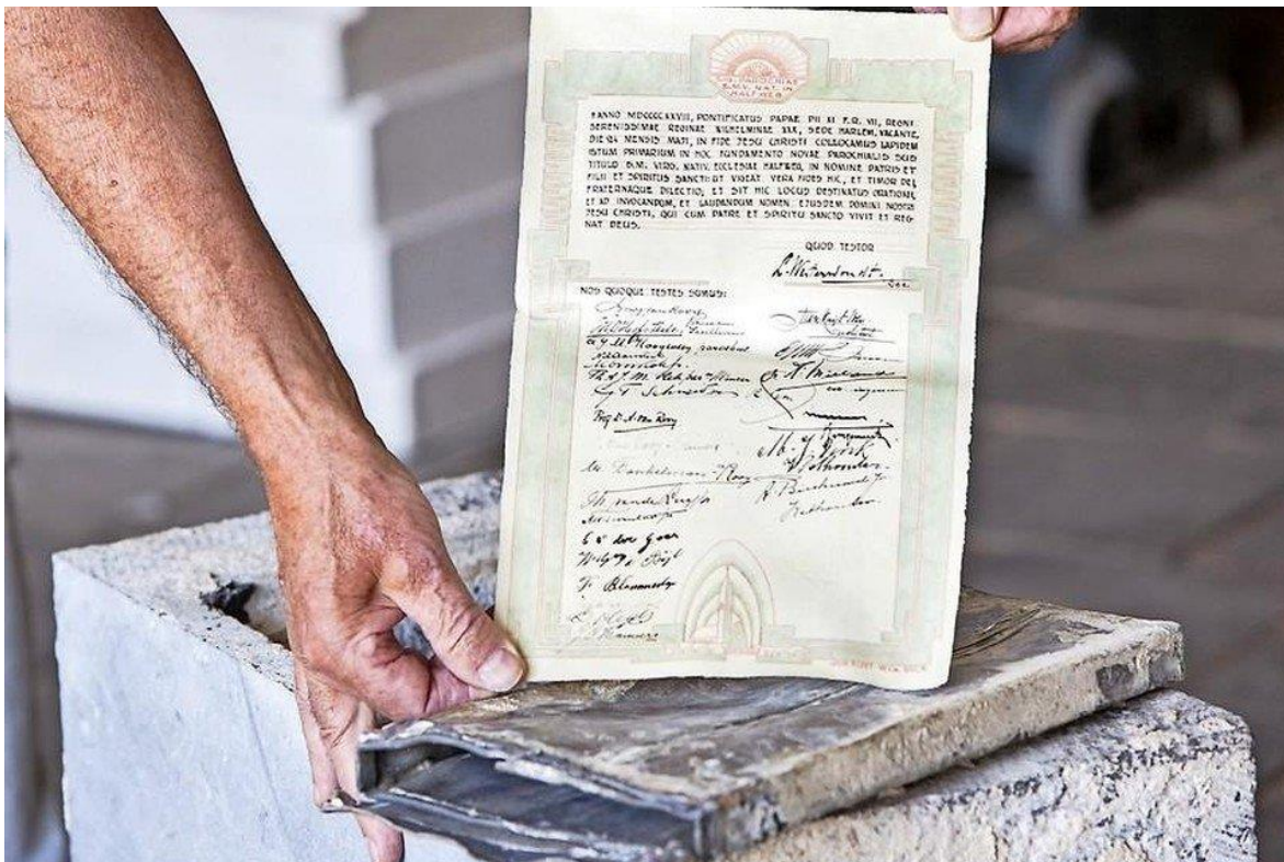
Document met loden enveloppe.

Richard Stekelenburg Haarlems Dagblad Donderdag 15 juni 2017 om 08:03