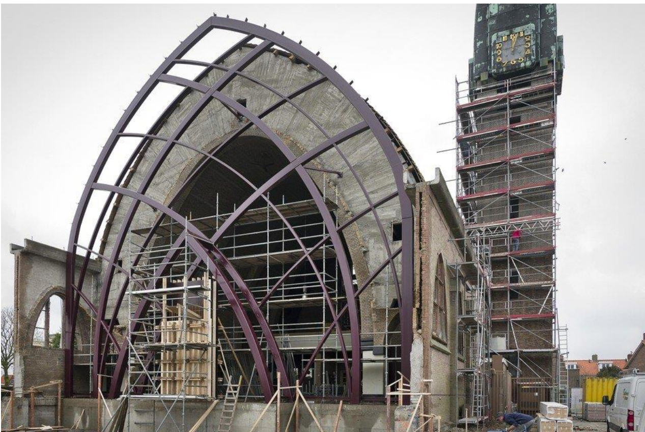
Het kerkgebouw is inmiddels gehalveerd.

(Andere ondertekenaars betreffen geestelijken, een professor, de architect en leden van het gemeentebestuur van Halfweg.)